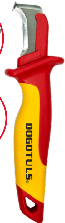
PELA CABLE CURVA